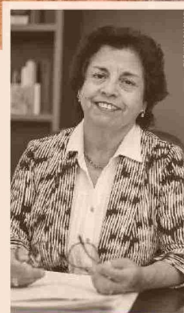
AURORA WILLIAMS, MINISTRA DE MINERÍA

La situación de las empresas se monitorea desde Sernageomin,