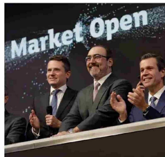
REPRESENTANTES DE CAF tocan la campana de la Bolsa de Londres tras la emisión de 1.000 millones de libras esterlinas, en noviembre del 2024.