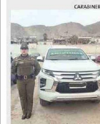
HUBO UN DETENIDO.