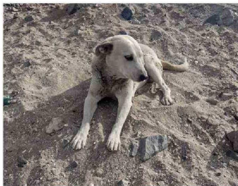
"LUNA", LA MÁS TÍMIDA DE LOS TRES PERRITOS QUE SIGUEN VIVIENDO EN EL RUCO DEL POBLADOR.