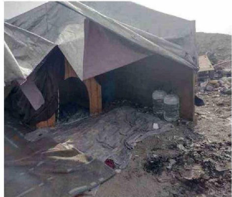
LA IDEA ES REDUCIR EL RUCO A UN REFUGIO PARA SUS PERRITOS.