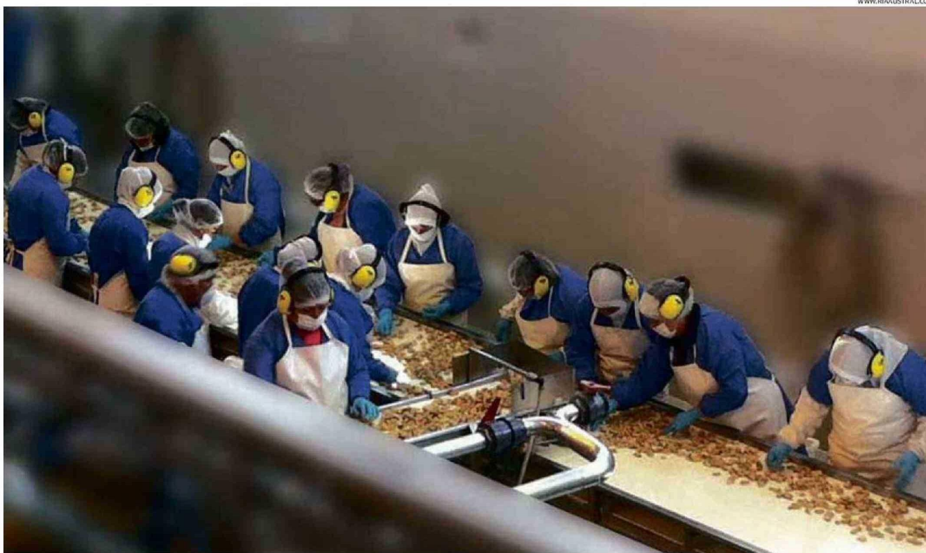
CHORITOS EXPORTA LA PLANTA DE PROCESO DE MEJILLONES RIA AUSTRAL DE LLANQUIHUE, DE ACUERDO A LA PÁGINA WEB, INCLUSO CON SUCURSALES EN ESPAÑA.