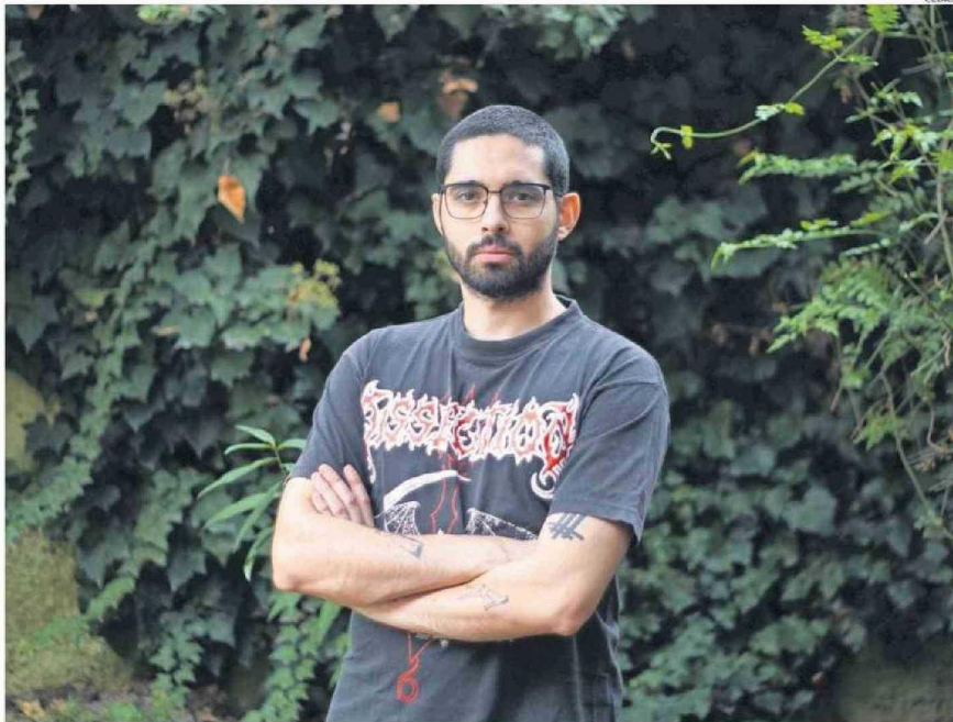
"ME PARECIÓ MÁS BIEN UN DEBER PUBLICAR ALGO PARA QUE SE HABLE DEL TEMA" DE LA SALUD MENTAL, DICE EL AUTOR.

—Todo el mundo, los psiquiatras, los cuidadores, los enfer-