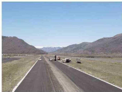
OBRAS REALIZADAS EN AERÓDROMO DE LONQUIMAY.