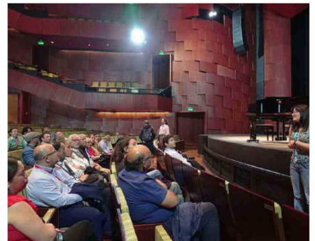
EL IMPRESIONANTE TEATRO DEL LAGO DE PUERTO VARAS FUE VISITADO POR LOS ASISTENTES AL ENCUENTRO.