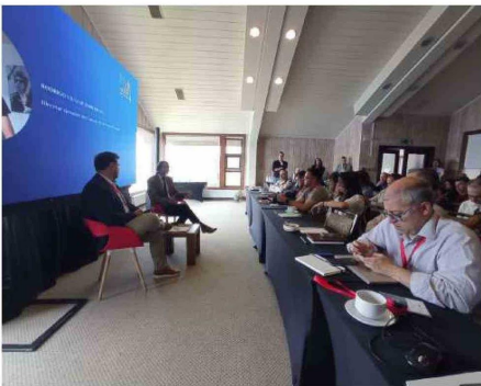
DESTACADOS EXPOSITORES ABORDARON TEMAS DE GRAN RELEVANCIA PARA EL FUTURO DE LA PRENSA NACIONAL.

y de calidad para mantener así la plena vitalidad de la libertad de expresión, base fundamental de toda democracia.