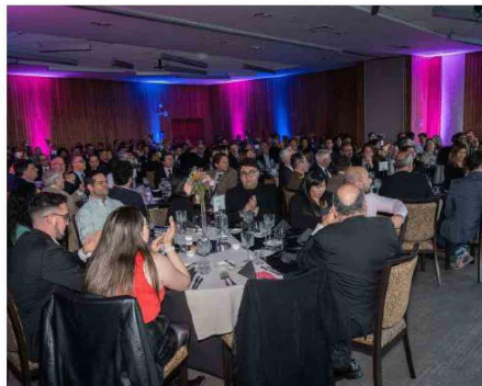
DURANTE LA CENA ANUAL DE LA PRENSA 2024, LA ANP ENTREGÓ IMPORTANTES RECONOCIMIENTOS.