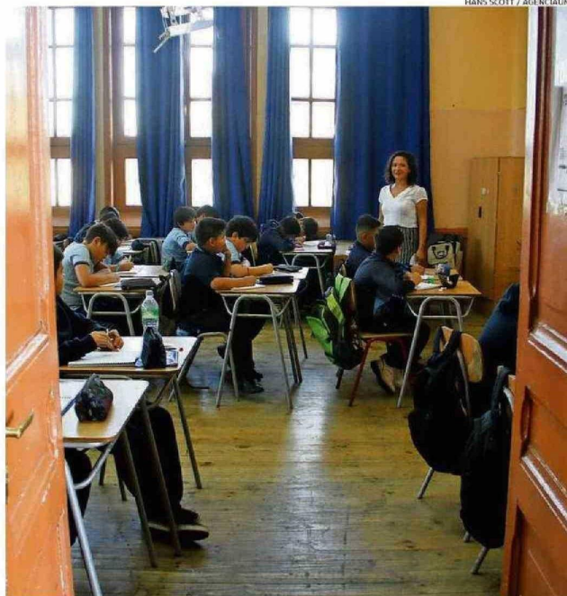
LOS ESCOLARES CHILENOS FUERON EVALUADOS POR PRIMERA VEZ EN SUS CAPACIDADES CREATIVAS.

El director del departamento de la Educación de la OCDE, Andreas Schleicher, aportó en la presentación del