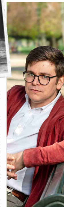
"Donoso nunca transó en su visión de la literatura como un arte autónomo. No estuvo dispuesto a simplificar su lenguaje o su imaginario", dice Joaquín Castillo.

Su apuesta por la perennidad, ante todo estética, parece haber sido una elección acertada, si lo comparamos con la vigencia de otras figuras del boom como Fuentes o Cabrera Infante".