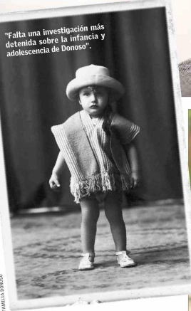
elementos sensacionalistas—, pues fue un hombre complejo, difícil y lleno de tablas, pero también contaba con una faceta luminosa, que esta lectura deja de lado".