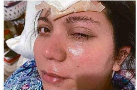
CON SU OJO IZQUIERDO INFLAMADO QUEDÓ TRAS LA OPERACIÓN.