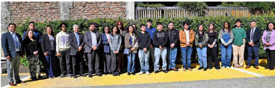
ALUMNOS DE ESTABLECIMIENTOS PÚBLICOS QUE FUERON DESTACADOS POR EL SERVICIO LOCAL DE EDUCACIÓN PÚBLICA 8SLEP.