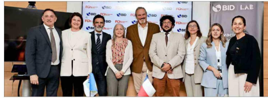
Firma de acuerdo para impulsar startups suscrita por BID Lab y Fundación Chile.

Acuerdos por US$ 180 millones con Hacienda para potenciar las regiones, por US$ 1,3 millones con Fundación Chile para impulsar startups, y la visita de una premio Nobel de Economía y líderes globales marcaron el evento que se realizó por tercera vez en el país. El side event en Punta Arenas, en tanto, “no cumplió con las expectativas” de autoridades locales. • GUILLERMO V. ACEVEDO