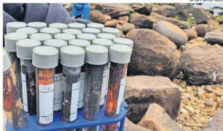
ALGUNAS DE LAS MUESTRAS TOMADAS EN LA ISLA.

“Estamos explorando otros hábitats costeros para poder encontrar esta levadura, con el objetivo de evaluar si ha logrado migrar.”