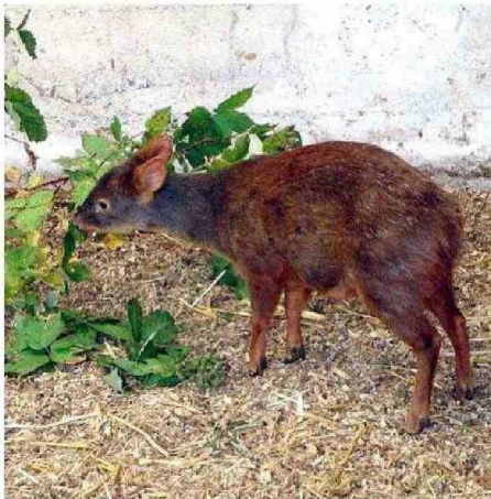
EL PUDÚ ES EL CIERVO MÁS PEQUEÑO DE CHILE.