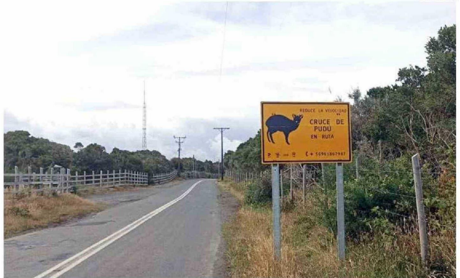
LETRETEROS COMO ESTOS ESTÁN INSTALADOS EN LAS DISTINTAS CARRETERAS EN CHILOÉ. ESTA SEÑAL ESTÁ A UN COSTADO DEL PARQUE NACIONAL.

"Vemos liebres donde no había; se observa pumas donde no deberían aparecer, porque está lleno de poblaciones. Cada vez, esto va avanzando más", advier-