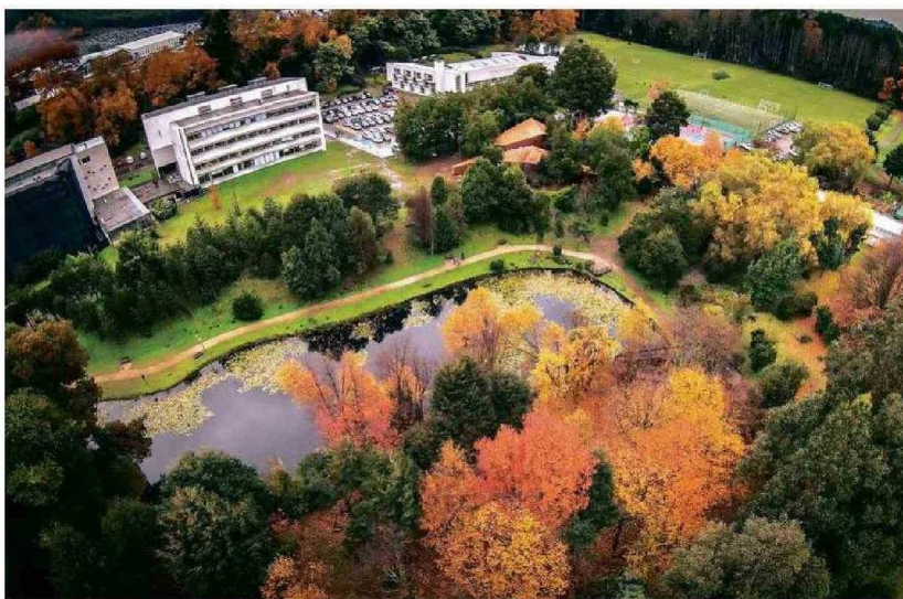
Campus San Juan Pablo II

Para sus estudiantes, muchos de los cuales provienen de contextos vulnerables, la universidad representa una oportunidad transformadora. El Rector Bórquez destaca que “la misión de la UCT es levantar la autoestima de los jóvenes y prepararlos para construir un futuro mejor”.