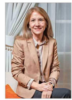
Actual vicepresidenta asumirá el 17 de diciembre hasta 2026.