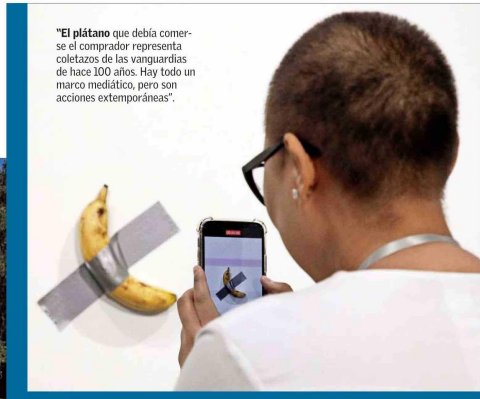
"El platano que debía comerse el comprador representa coletazos de las vanguardias de hace 100 años. Hay todo un marco mediático, pero son acciones extemporáneas".

"Todo eso fue antes del Fondart! Hubo una participación muy grande en los años 80. Muchos bancos y entidades privadas estaban involucrados en el arte y con muy buenos resultados. Existían los concursos, como el de la Colocadora Nacional de Valores, la Crav; Amigos del arte, etc. Vino, a su vez, la muestra de Rauschenberg que fue un hito en Chile, pues ni en el MoMA se da una exposición de esa envergadura. Fue un aporte maravilloso. Pero después se ha dado una espe-