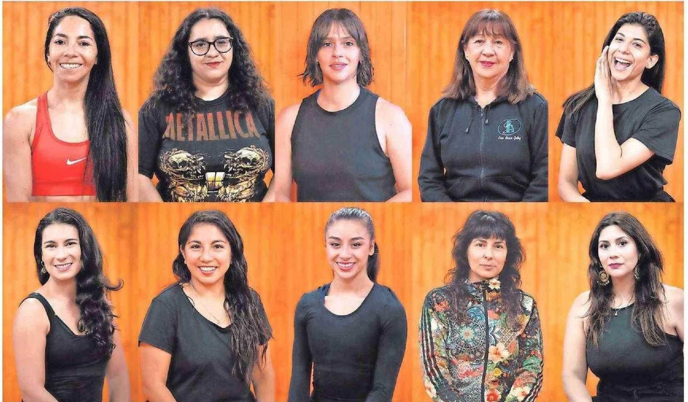
DURANTE EL 2024 EL CENTRO CULTURAL HA GENERADO UNA SERIE DE CONTRATACIONES QUE HACEN QUE LAS BRECHAS DE GÉNERO EMPLEABILIDAD SE REDUZCAN.