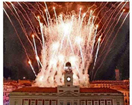
LA PUERTA DEL SOL DE MADRID TUVO SUS FUEGOS ARTIFICIALES.