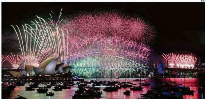
SIDNEY RECIBIÓ EL 2025 CON UN ESPECTÁCULO PIROTÉCNICO COLORIDO.