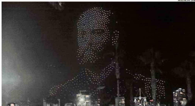
IQUIQUE UTILIZÓ DRONES PARA MOSTRAR IMÁGENES SIGNIFICATIVAS PARA LA CIUDAD, COMO ARTURO PRAT.