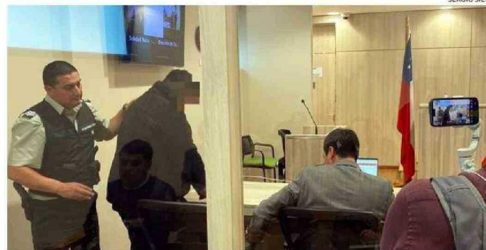
EL JUEVES SERÁ LA FORMALIZACIÓN DEL PATRÓN DE LA EMBARCACIÓN SINIESTRADA.

Tras esta tragedia, existe preocupación sobre la fiscalización y la capacidad de pasajeros que pueden transportar este tipo de embarcaciones.