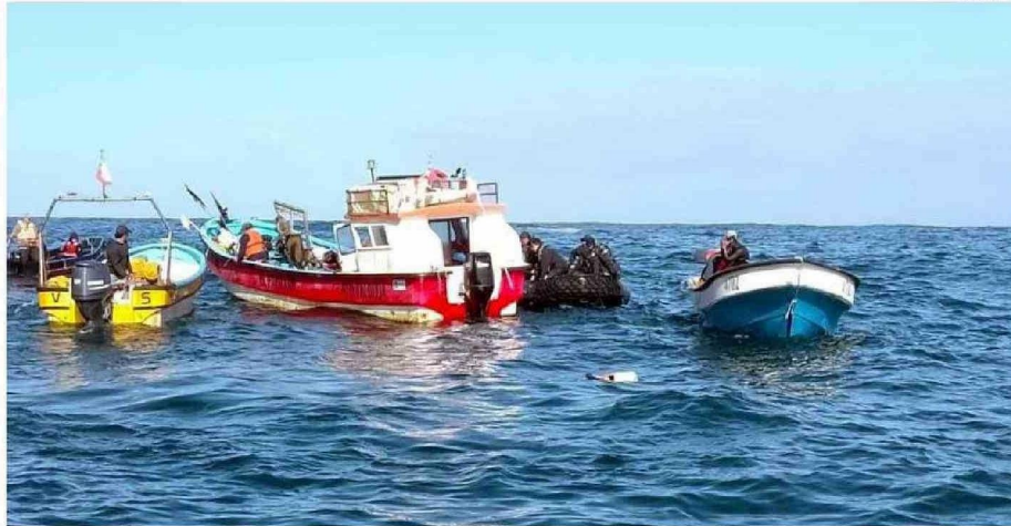
CERCA DE LAS 10 DE LA MAÑANA, SE HIZO EL HALLAZGO DE LA EMBARCACIÓN Y DE LOS TRES CUERPOS RESTANTES QUE FALTABAN POR UBICAR.