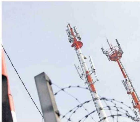
ADVIERTEN FALTA DE CONECTIVIDAD EN ZONAS RURALES.

TAMARUGAL Realidad distinta a lo que se vive en la provincia del Tamarugal, donde comunas como Pozo Almonte y