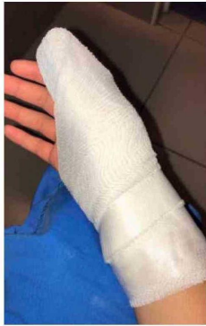
Algunos de los registros de funcionarios ante la violencia recibida.

no es exclusivo del servicio mencionado "Esta es una situación que no abarca solamente a salud mental infantil, sino que también a la parte de adultos y tiene que ver con las múltiples agresiones que han sufrido los funcionarios por este tipo de pacientes, donde lamentablemente nos hemos visto expuestos a una escasez de protocolos, donde no hemos tenido respuesta de las entidades superiores a cómo manejar esta situación. Darle un abordaje concreto a los funcionarios, donde también han fallado el tema de mutualidad, que a los funcionarios agredido no se dan la cantidad de días de licencia necesarios, no se aborda como corresponde".