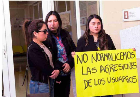
Los funcionarios se movilizaron para exponer su caso y exigir respuestas a las autoridades.