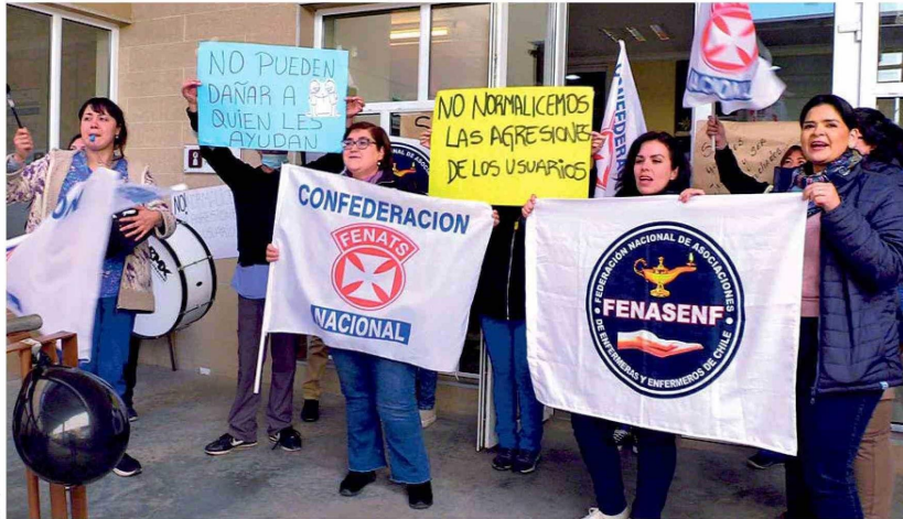
Funcionarios del Salud Mental del HRR se movilizan tras violentas agresiones de pacientes

Trabajadores del servicio de salud mental infanto-juvenil del recinto asistencial denunciaron fuertes hechos de violencia física por parte de pacientes del dispositivo. Exigen mejoras en los protocolos de seguridad y apoyo institucional. Desde dirección del hospital ha iniciado acciones legales para proteger a su personal.