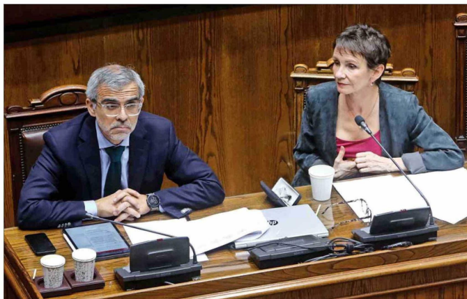
El subsecretario del Interior, Luis Cordero, y la ministra del Interior, Carolina Tohá, se han tenido que pronunciar ante las críticas al proceso.

El alcalde White, por ejemplo, aseguró en La Tercera que "en la tasa de homicidios ha quedado revelado que el Plan Calles Sin Violencia, en el caso de San Bernardo, no ha tenido resultados. Solicitamos un plan especial y nuevo para abordar esta delincuencia que no solamente es de una comuna determinada".