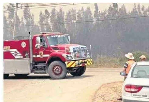
EN LOS VECINOS HUBO INQUIETUD ANTE EL SINIESTRO.

cional, de manera clara. Hay personas que están quemando en Los Álamos. Estamos coordinados con Carabineros, Bomberos, Conaf, Forestal Arauco y Seremi de Salud para afrontar esta situación”.