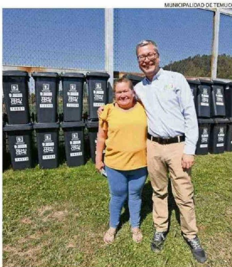
NEIRA DESTACA EL ESFUERZO EN RECICLAJE EN DISTINTOS BARRIOS.

26 vehículos y 12 motos constituyen la flota municipal para seguridad ciudadana.