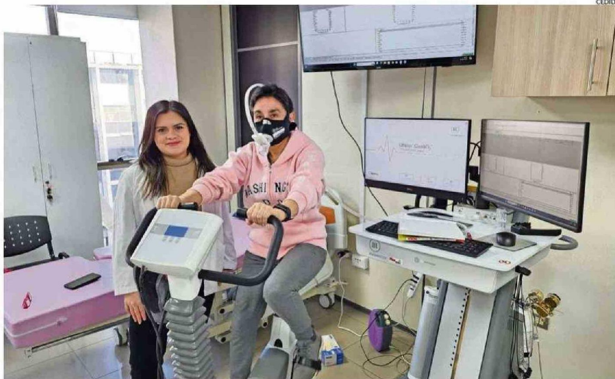
Las participantes realizan una serie de rutinas, entre ellas de tipo interválico de intensidad vigorosa en una bicicleta estática.

Tanto este tipo de cáncer como otras patologías cardiovasculares se agravan por el sedentarismo, que es la falta de actividad física y un estilo de vida inactivo. Esto es, detalla Álvarez, en no practicar actividad física de baja a moderada intensidad de 150 a 300 minutos duran-