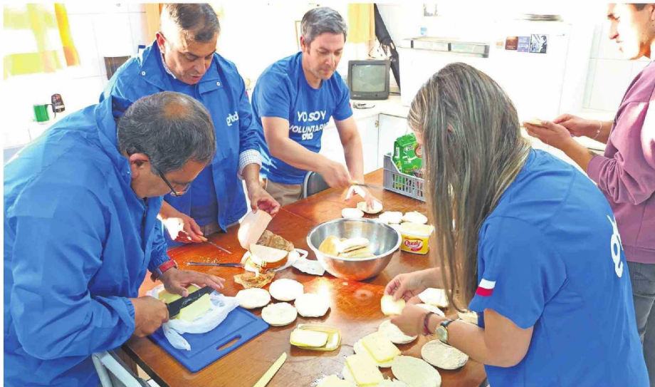
LOS VOLUNTARIOS HAN SIDO Y SIGUEN SIENDO EL MOTOR DE ESTE PROGRAMA QUE ACERCA A PERSONAS EN LAS CALLES.

Tiraje: 8.000 Lectoría: 16.000 Favorabilidad: No Definida