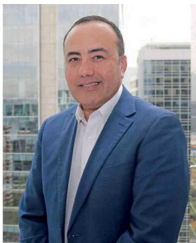
Por Guillermo Ahumada , Socio Líder de Educación Superior y Aplicaciones Empresariales en Deloitte Chile.

La educación superior en Chile enfrenta un cruce de caminos donde los retos y las oportunidades convergen.