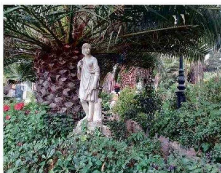
LAS ESCULTURAS SON OBJETOS CARACTERÍSTICOS DEL JARDÍN.