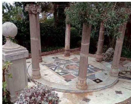
VISTA AL TEMPLETE DEL MUSEO CON EL PISO INFLUENCIADO EN EL DEL PALACIO ERRÁZURIZ.

sombra que hoy dificultaría cualquier intento de cultivo.