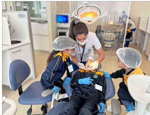
Docentes de la Escuela de Odontología UC les enseñaron a los niños cómo mantener su sonrisa saludable, en una Travesía de 2023.

compresiones?”, grita un estudiante interno de Medicina en medio de una sala copada por alumnos de 3° y 4° medio del colegio Libertador Simón Bolívar de Macul. La respuesta es unánime: “¡Cuando llega la ambulancia o puede respirar!”. La escena no transcurre en una sala de clases en la que los estudiantes están sentados en sus puestos y miran un pizarrón, sino en el Centro de Simulación UC, equipado con torsos de espuma, muñecos “asfixiados” por un trozo de plástico,