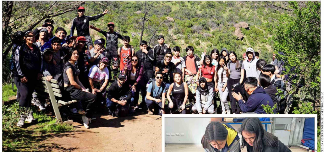
En una visita a la Quebrada de Macul, estudiantes del Centro Educativo Eduardo de la Barra de Peñalolén aprendieron a identificar riesgos naturales.

“¡Vamos, continúen! Dos, tres, cuatro... ¿Cuándo debo detener las