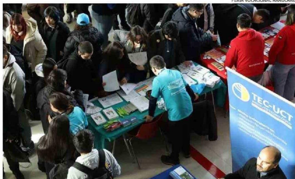
LA FERIA CONTÓ CON STANDS CON INFORMACIÓN DE UNIVERSIDADES, INSTITUTOS PROFESIONALES (IP) Y CENTROS DE FORMACIÓN TÉCNICA (CFT), SUS CARRERAS, LAS ESPECIALIDADES Y REQUISITOS DE INGRESO.

Asimismo, se realizaron charlas temáticas, entre ellas “Qué necesitas para transformar el