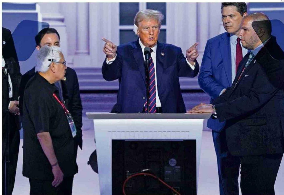
TRUMP DEBERÁ ACEPTAR HOY LA NOMINACIÓN DE SU PARTIDO EN LA CONVENCION DE MILWAUKEE PARA CORRER OFICIALMENTE A LA CASA BLANCA.