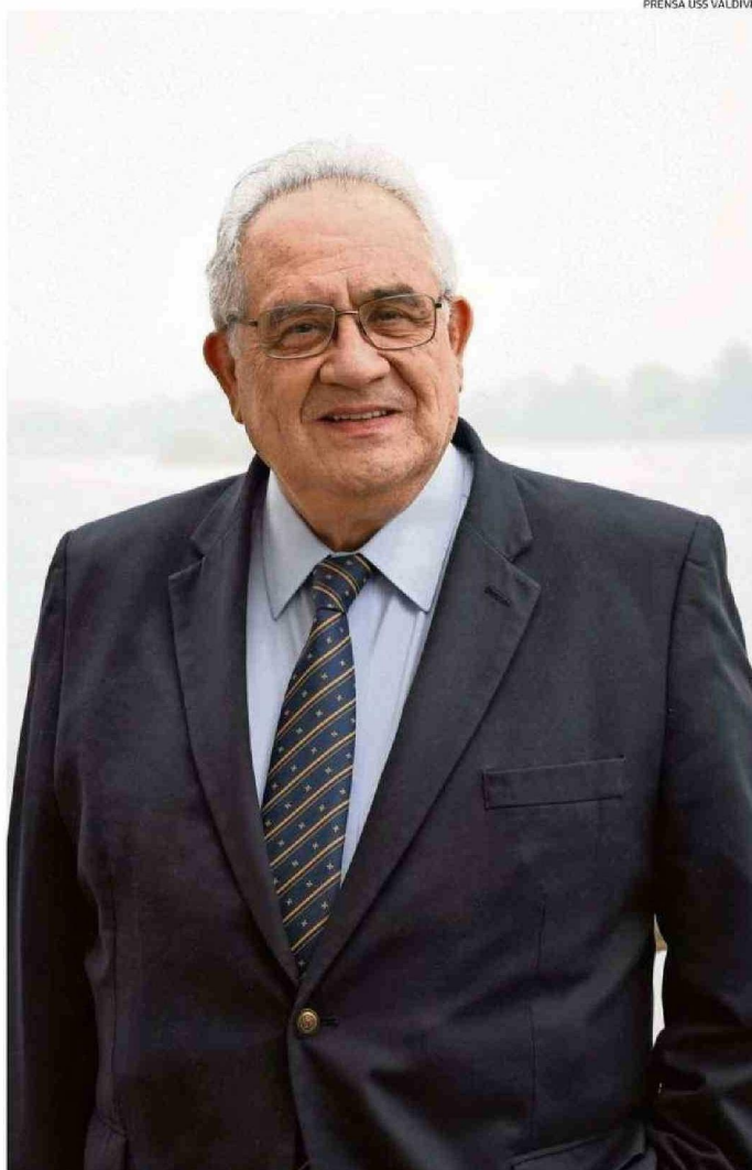
HUGO LAVADOS FUE MINISTRO DE ECONOMÍA Y DESDE 2023 ESTÁ AL MANDO DE LA USS.

Y agregó: "Es muy importante para nosotros tener científicos destacados haciendo clases en pregrado. A los estudiantes les brinda una gran oportunidad de acceder a otros conocimientos y ser parte de un proceso de excelencia. Y a los investigadores les permite estar en contacto con las nuevas generaciones, con gente joven, sus intereses y con los déficit