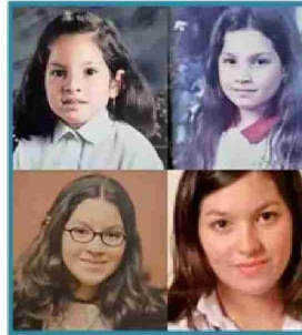
Javiera Toro, ministra Desarrollo Social, puso varias fotos de sus primeros días en básica y media.