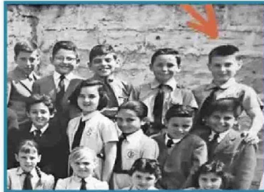
El canciller Alberto van Klaveren publicó una foto de 1959 cuando estaba en quinto básico y ya mostraba interés por los temas internacionales.