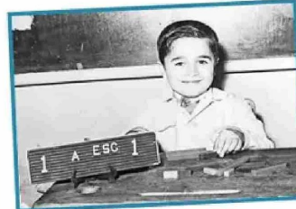
El ministro Esteban Valenzuela inició su educación en el colegio Moisés Mussa de Rancagua.