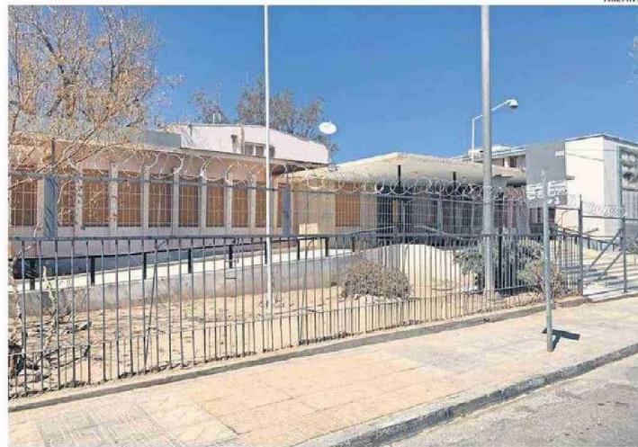
DE ACUERDO A LO INFORMADO POR EL SERVICIO DE SALUD, EL EXCENTRO ASISTENCIAL DEBE SER DEMOLIDO DURANTE EL PRÓXIMO AÑO.

El Servicio de Salud Antofagasta informó además, en cuanto a la pro-