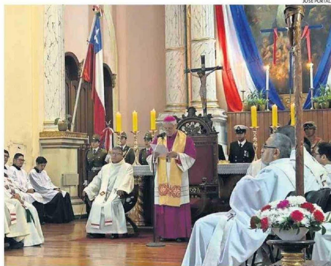
OBISPO DE IQUIQUE ENTREGÓ POSTURA POR PROYECTO DE ABORTO Y EUTANASIA.

En el mismo sentido expresó que “la ausencia de paz es muy triste que, en cuanto va del año, han muerto 10 personas en la frontera de Colchane; personas que, se supone, emigraban buscando paz y prosperidad. No hay paz