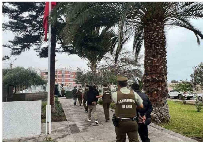
LUCHA CONTRA EL DELITO NO CESA, PESE A LAS ÚLTIMAS CIFRAS.

El representante de Arica y Parinacota en el parlamento agregó que "Es imperativo que se entienda que el resguardo geopolítico del país exige el desarrollo integral y la seguridad de Arica y Parinacota. Desde el Ministerio del Interior se debe atender con urgencia esta situación.