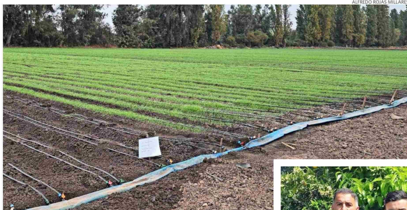
La planificación le permite obtener una calidad homogénea y tener producción estable.

ra ayer, que siempre hay que anticiparse", comenta.