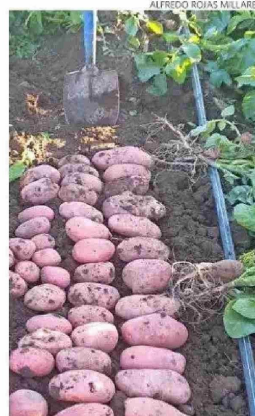
La temporada 2023 obtuvo 2 mil sacos de papas por há.

novaciones el agricultor dobla la producción y mantiene una alta calidad de sus productos.