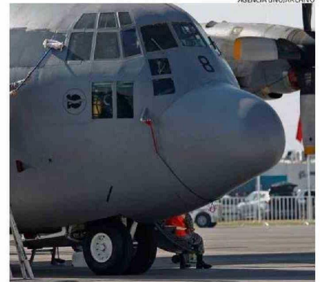
UN AVIÓN HÉRCULES C-130 COMO EL SINIISTRADO.