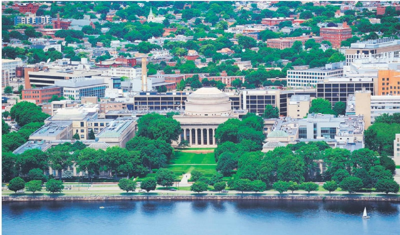
Instituto Tecnológico de Massachusetts (MIT)

Son 24 las casas de estudio que la consultora británica destaca en su ranking anual, que estudia a 5.000 planteles de todo el mundo.