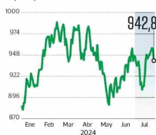
Dólar En pesos por US$