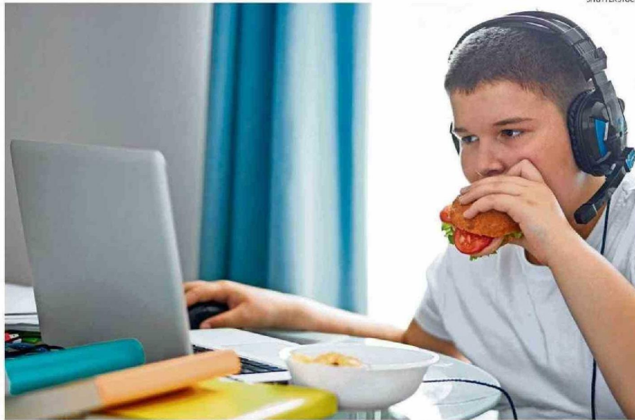
La comida rica en sal, azúcar y grasas puede afectar la salud y el desarrollo de los adolescentes.

"Ver ofertas de comida, tener mayor acceso a eso, genera que uno consuma mucho más alimentos de este tipo. También, a raíz de lo mismo, hay una mayor preferencia por alimentos prácticos y rápidos, lo que genera que la persona coma comida, más comida y más calorías. Y por último, al no prestar atención y no estar concentrado mientras se come, se ignoran las señales de saciedad, en este caso, lo que finalmente conlleva a comer más alimento, llevando a