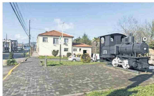
El sector de Lota Alto fue declarado Zona Típica en 2014 y se caracteriza por pabellones de viviendas que están instalados a lo largo de la avenida Carlos Cousiño, que al día de hoy se mantienen con un alto grado de autenticidad. Esta área fue parte de la segunda etapa de crecimiento de una ciudad que fue un enclave colonial. En 1962 la ciudad se fundió bajo el nombre de Santa María de Guadalupe en el actual sector de Lota Bajo, hasta que adquirió el nombre de indígena "lota" o "pequeño caserío".

Estos bienes son declarados por decreto supremo del Mineduc, generalmente en respuesta a una solicitud de personas, comunidades u organizaciones, con previo acuerdo del Consejo de Monumentos Nacionales.