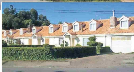
Este espacio coronelino fue un área cerrada que estaba bajo el control de la compañía carbonífera. Sus edificaciones comunitarias y el equipamiento urbano se transformaron en un aporte a la configuración de las ciudades y fueron la base para el diseño que hasta la década de 1970 entregara el Estado por todo el país, según describe el Consejo de Monumentos Nacionales.