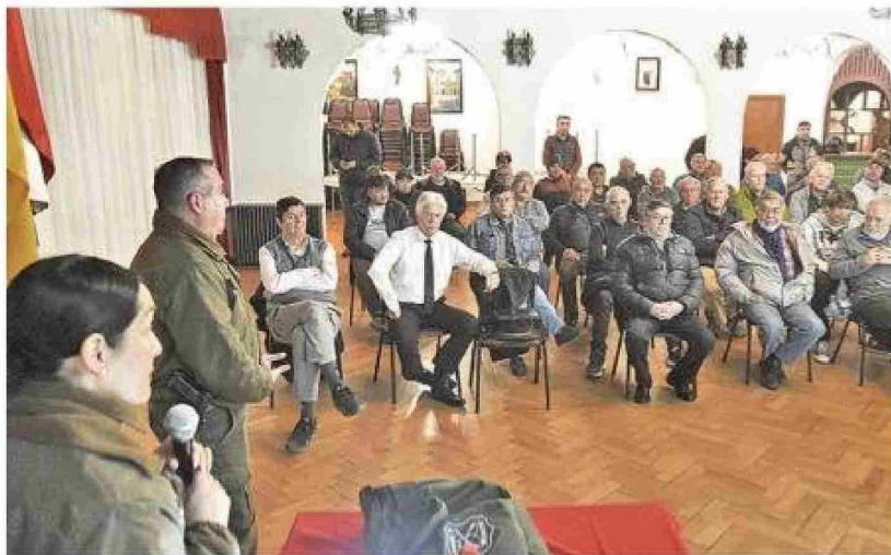
La autoridad fiscalizadora, en este caso Carabineros, ofreció una charla a socios de los diferentes clubes de Caza y de Tiro, los alcances del nuevo reglamento complementario de la Ley N°17.798 sobre Control de Armas, Explosivos y Elementos Similares.