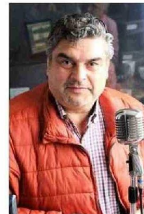
EL CONSEJERO REGIONAL MIGUEL ÁNGEL CONTRERAS, PLANTEÓ EL TEMA DE LOS ADULTOS MAYORES QUE VIVEN EN SITUACIÓN DE HACINAMIENTO.

Finalmente, Contreras dijo que “estimo que en lo referido al hacinamiento medio y crítico que están experimentado más de cinco mil adultos mayores de Temuco y Padre Las Casas, según nos indica que el Instituto Nacional de Estadística