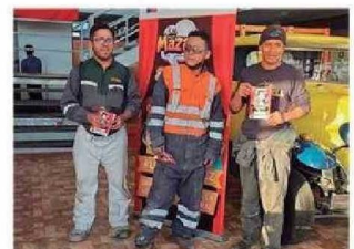
Personas presenciaron y fueron partícipes de la Obra de Teatro LOS MAZALEZ en Calama.