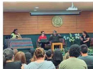
Personas presenciaron y fueron partícipes de la Obra de Teatro LOS MAZALEZ en Santo Tomás Arica.