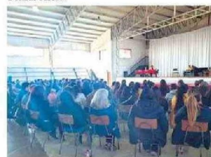
Personas presenciaron y fueron partícipes de la Obra de Teatro LOS MAZALEZ en La Serena.