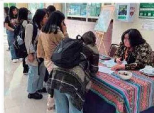
Personas presenciaron y fueron partícipes de la Obra de Teatro LOS MAZALEZ en CFT Arica.