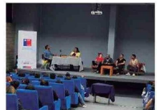
Personas presenciaron y fueron partícipes de la Obra de Teatro LOS MAZALEZ en UTA Arica.