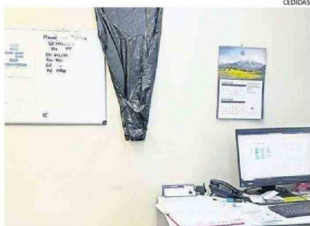
CON BOLSAS TIENEN QUE EVITAR LAS GOTERAS CUANDO LLUEVE.

que entregar salud muchas veces en condiciones paupérrimas, en las cuales nuestro per cápita y el financiamiento no da abasto para satisfacer las necesidades de la población. La infraestructura está desmejorada y en algunos casos indigna tanto para los usuarios como también para nuestros compañeros”, añadió.