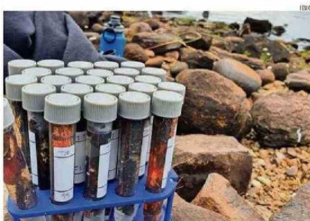
Algunas de las muestras tomadas en la isla.