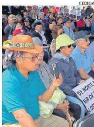
SOLCOR SERÁ LA ANFITRIONA.