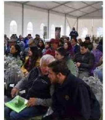
INICIATIVA BUSCA POTENCIAR EL RUBRO.